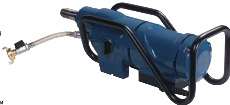
CDM 33 W